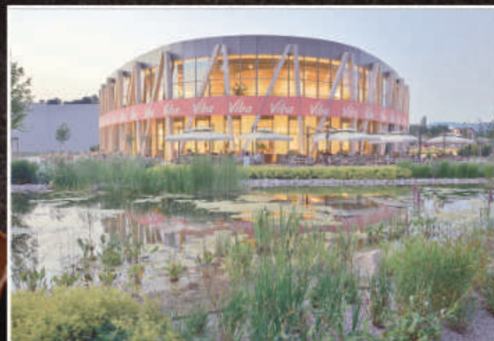
VIBA Nougatwelt | Schmalkalden

Unter dem neuen Markennamen „Viba“, der an die Gründerfamilie erinnerte, entwickelte das neue Führungsduo innovative und marktfähige Produkte. Zusätzlich wurde 1997 ein neues Produktionsgebäude in Floh-Seligenthal bei Schmalkalden errichtet, da die alte Fabrik marode und die Maschinen veraltet waren.