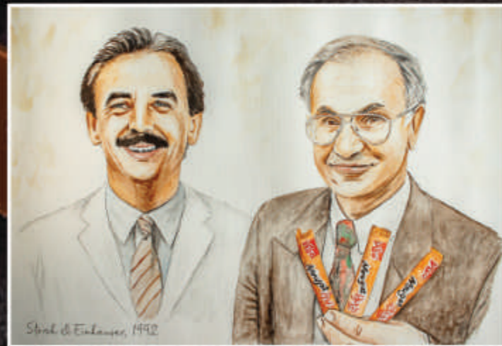
Storch & Einhäuser